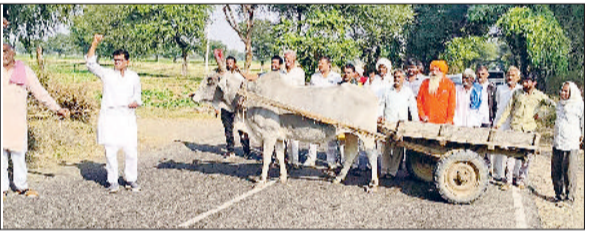
बहल। बैलगाड़ी लेकर रोड जाम करते हुए।

पोषक अनाज अनुसंधान केन्द्र गोकलपुरा में हरे पेड़ों को काटे जाने पर विभागीय कार्रवाई नहीं होने से नाराज गोकलपुरा गांव के ग्रामीणों ने बहल भिवानी मार्ग पर प्रदर्शन किया व सांकेतिक रोड जाम किया। प्रदर्शन में ग्रामीण गांव से बैलगाड़ी पर लेकर केन्द्र के सामने मेन रोड तक गए और बैलगाड़ी को रोड के बीचों बीच लगाकर जाम लगाया। ग्रामीणों ने कहा कि वन विभाग के अधिकारी केन्द्र के अधिकारियों से मिलकर मामले को दबाने के प्रयास