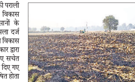
बवानीखेड़ा। गांव अलखपुरा के खेतों में किसानों द्वारा पराली में लगाई आग।

खिलाफ विभिन्न धाराओं के तहत मामला दर्ज कर लिया।