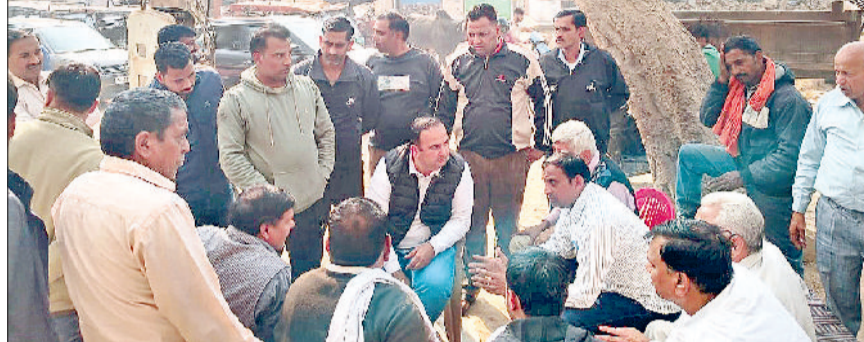
भिवानी। सर्विस रोड को लेकर कार्यकारी अभियंता से बातचीत करते सोसायटी के पदाधिकारी।