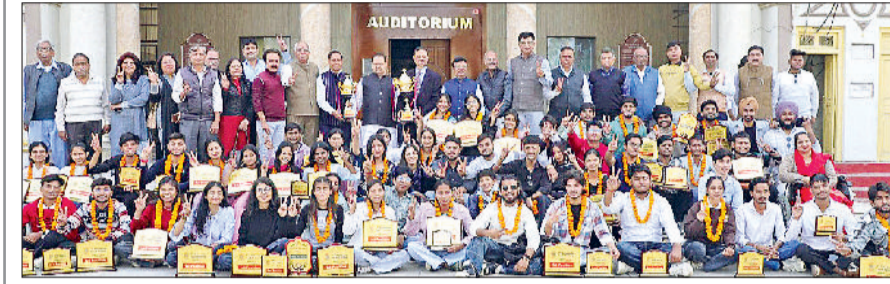
मिवानी। ओवरऑल ट्रॉफी के साथ प्रतिभागी व विजेता विद्यार्थी।