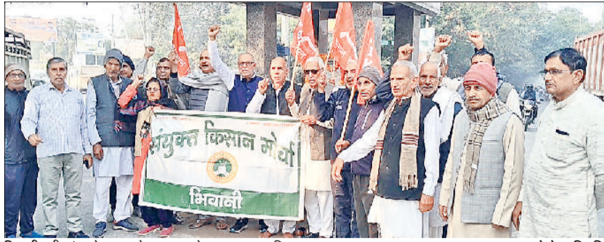
मिवानी। दीनबंधु छोटूराम को नमन करते गणमान्य नागरिक।