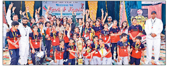
मिवानी। दिल्ली वर्ल्ड पब्लिक स्कूल में जीत की खुशी मनाते प्रतिभागी।